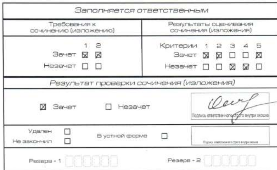
Рис. 2. Область для оценки работы

После окончания заполнения копии бланка регистрации эксперт комиссии по проверке ставит свою подпись в специально отведенном для этого поле.