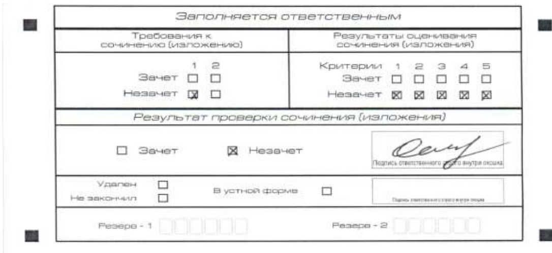
Рис. 1. Область для оценки работы

Если итоговое сочинение (изложение) соответствует требованию № 1 и требованию № 2, то эксперт комиссии по проверке выставляет «зачет» за выполнение требования № 1 и требования № 2. Указанные сочинения (изложения) оцениваются по критериям.